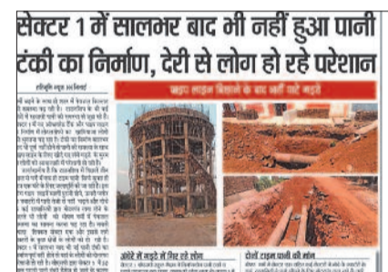
सेक्टर 1 में सालभर बाद भी नहीं हुआ पानी टंकी का निर्माण, देरी से लोग हो रहे परेशान